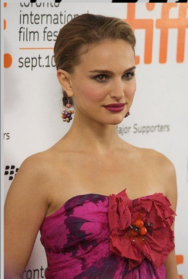
Natalie Portman – Israelsko-Americká herečka