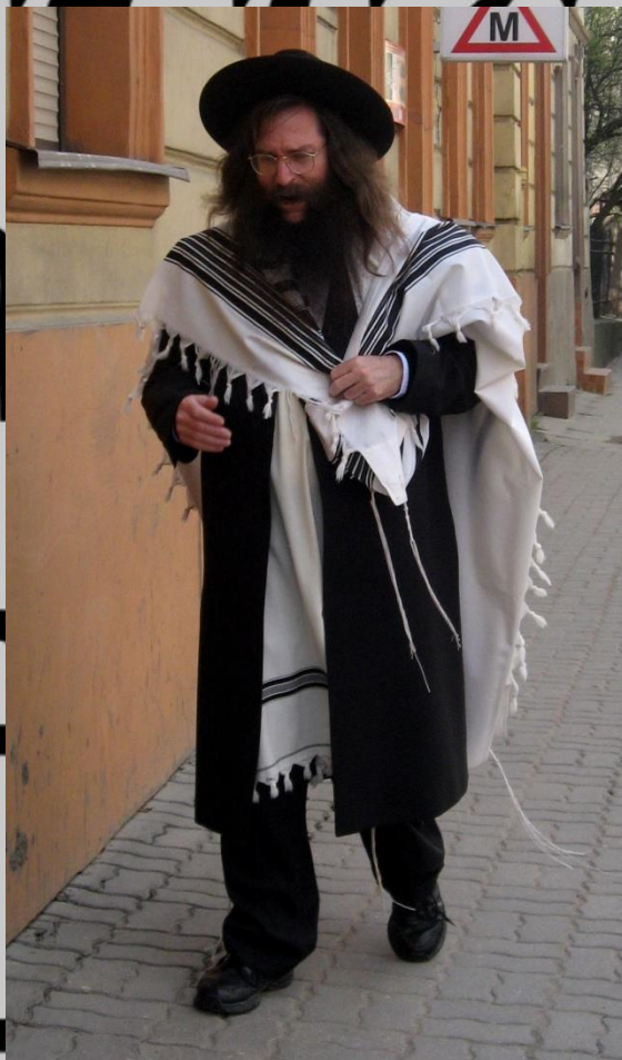
žid na ulici